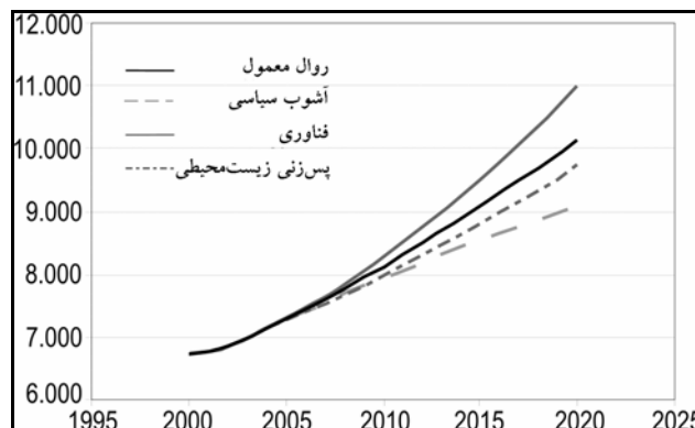
مقایسه چهار سناریوی انرژی جهانی ۲۰۲۰